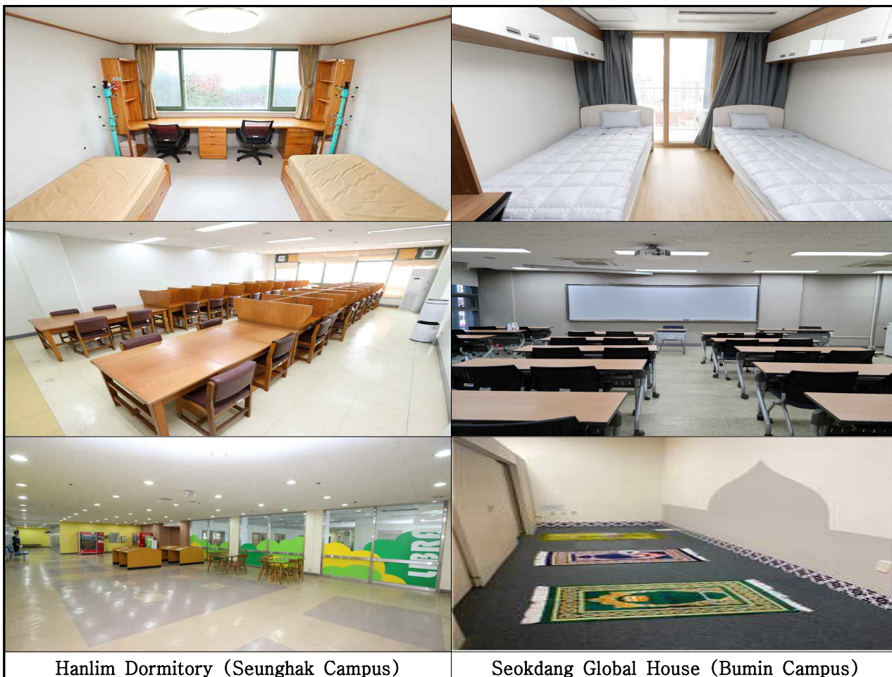
Hanlim Dormitory (Seunghak Campus)

※ For Seokdang Global House, the priority is given to the students who are taking Korean Language Course in Dong-A university. Furthermore, the room may not be available to the GKS scholars due to the vacancy rate of the dorm.